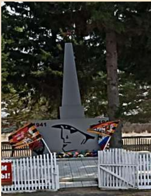
ПАМЯТНИК «ЗАЩИТНИКАМ ОТЕЧЕСТВА»